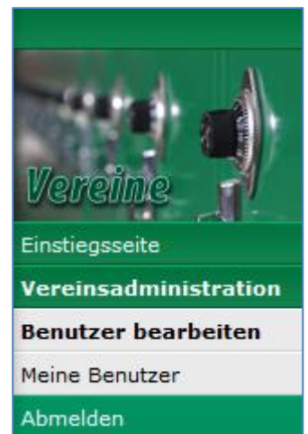
Bild 3 - VA-Menü

Hier werden Ihnen Nutzer angezeigt, die eine Berechtigung für Ihren Verein besitzen.